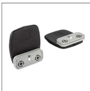
Блочная присоска VCBL-B 120x50x29 TV