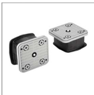
Блочная присоска VCBL-B 140x130