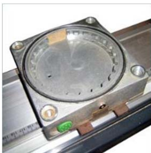
Все типы VC-B подходят для данной установочной рамки для вакуумных подушек