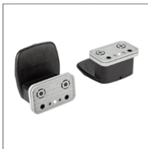
Блочная присоска VCBL-B 125x75x74 TV