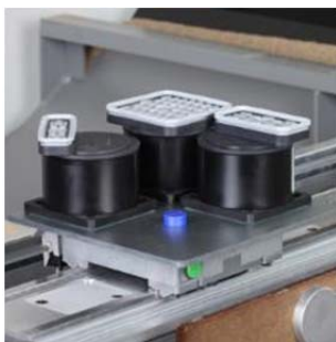
Адаптерная плита ISAP-B 195x195 (здесь показана с Mono-Bases и присосками)