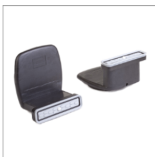
Блочная присоска VCBL-B 130x30x74 TV