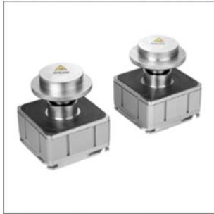
Механический зажим VCMC-B D120